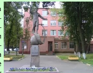
Люберецкий техникум и памятник Ю. Гагарину

В 70-е -80-е годы в Люберцах строятся новые школы и детские сады, которые оснащаются по последнему слову педагогической науки: бассейны, спортзалы, оранжереи, живые уголки, и как следствие, огромное количество кружков и секций. В районе проходят спортивная - милицейская игра «Щит и меч», военно-спортивная игра «Зарница», турслеты, активно функционируют пионерские и комсомольские организации, выездные лагеря актива.