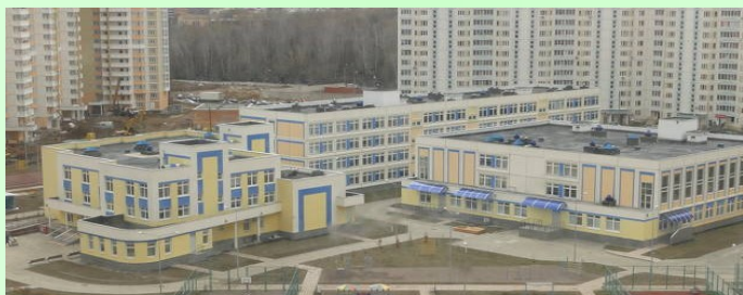
Гимназия №16 «Интерес», 2013 год

В новом тысячелетии Люберецкая система образования выходит на новый уровень. Начинается модернизация, которая затрагивает все сферы школьной жизни. В связи с интенсивным строительством жилья в районе и увеличением роста населения в северной части горда строятся новые, современные школы: Лицей №15, наша Гимназия №16 «Интерес», школа №27.