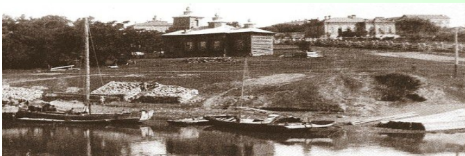
На пригорке - здание земской школы

К концу девятнадцатого века арендуемое помещение было не в состоянии принять всех желающих учиться, и земская управа приняла решение строить собственную школу. Новое здание, из трех отдельных небольших корпусов, было возведено на рубеже 19 и 20 веков. Их руины можно увидеть и сейчас на высоком берегу бывшего пруда.