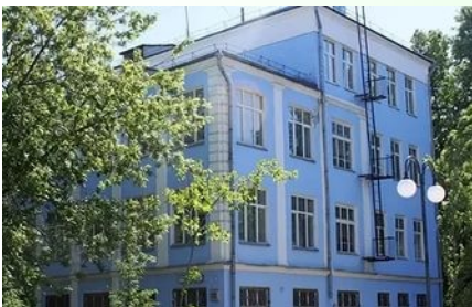
Современное здание гимназии №1

ном купеческом доме. В 1936 году было построено современное здание гимназии №1. В советское время в районе начинает развиваться профессиональное образование и был образован Люберецкий техникум.